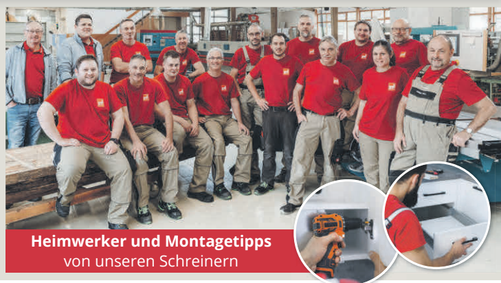
Heimwerker und Montagetipps von unseren Schreibern