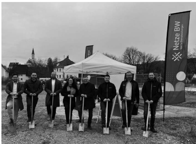
Foto: Spatenstich Glasfaserausbau mit Vertretern der Netcom-BW, Netze BW und Gemeinde

Alle Informationen zum Vorhaben, zu Produkten und Angeboten der NetCom BW finden Interessenten weiterhin auf der Unternehmenswebseite unter https://www.netcom-bw.de/kirchberg-iller . Fragen können jederzeit über www.netcom-bw.de/kontaktformular an die Mitarbeiter*innen der NetCom BW gerichtet werden.